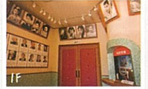
쇼와시대의 영화관 모습이 감도는 옛날식 영화관. 지난날의 인기 스타 사진과 코멘트도 전시하고 있습니다.