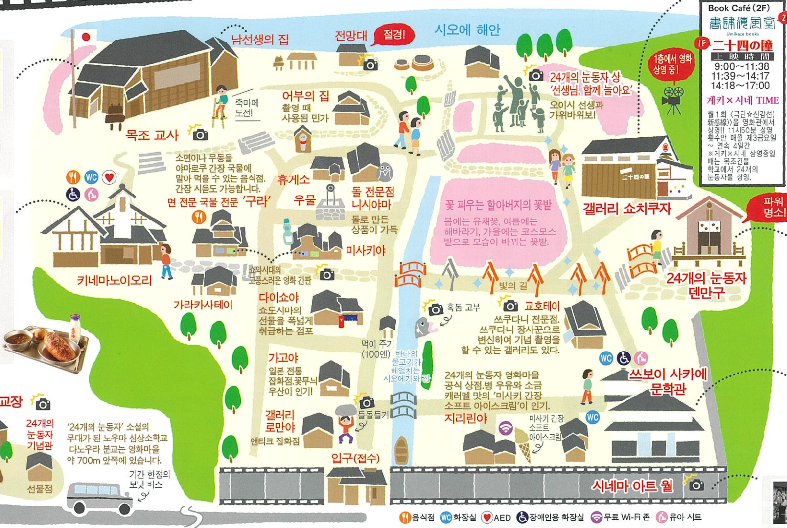
2층은 편히 쉬 수 있는 공간의 북 카페. 창문에서의 조망은 최고입니다!