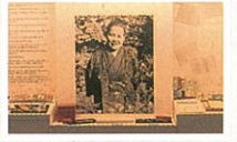
'24개의 눈동자' 원작자인 쓰보이 사카에가 애용하던 비품과 육필 원고를 전시하고 있습니다.