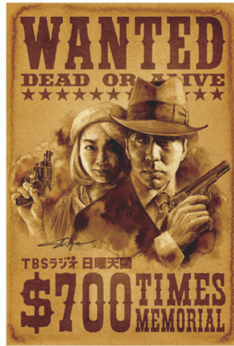
TBSラジオ「安住紳一郎の日曜天国」ポストカード