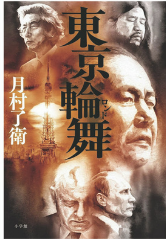
「東京輪舞」著:月村了衛(小学館)(デザイン:bookwall)