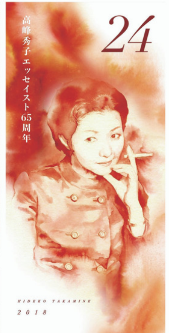
二十四の瞳映画村リーフレット(デザイン:西村まゆ子)