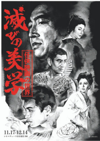
シネマヴェーラ渋谷 ポスター&フライヤー