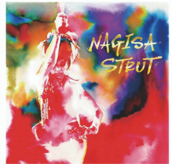
渚ようこ CDジャケット(デザイン:菅沼朋香)