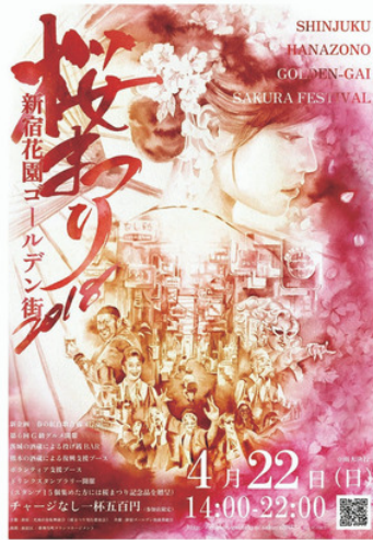
新宿ゴールデン街「桜祭り2018」ポスター